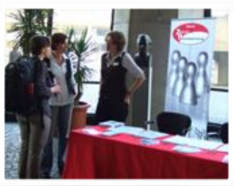
Der Informationsstand des Zentrum Patientenschulung beim Rehabilitationswissenschaftlichen Kolloquium 2011 in Bochum

Im November 2010 richtete das Zentrum Patientenschulung seine 6. Fachtagung in Würzburg aus. In zwei großen Themenblöcken wurden internationale Trends in der Patientenschulung einerseits und Standards