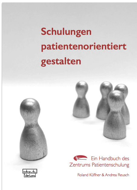
Abbildung 4: Deckblatt und Inhaltsverzeichnis des Handbuchs „Schulungen patientenorientiert gestalten“