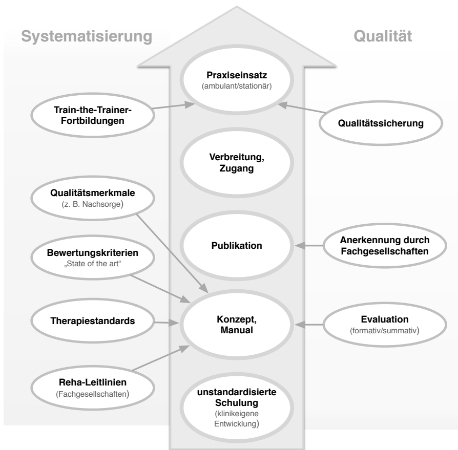
Abbildung 3: Einflussfaktoren der Schulungsentwicklung

Ergänzt werden sollte das Buch durch eine Sammlung von Qualitätskriterien der Schulungsumsetzung und eine Übersicht über die Anforderungen an die Qualifikation von Schulungsdozenten. Ein Online-Anhang sollte zudem Arbeitsmaterialien bereitstellen, die den praktischen Nutzen des Handbuchs noch weiter erhöhen.